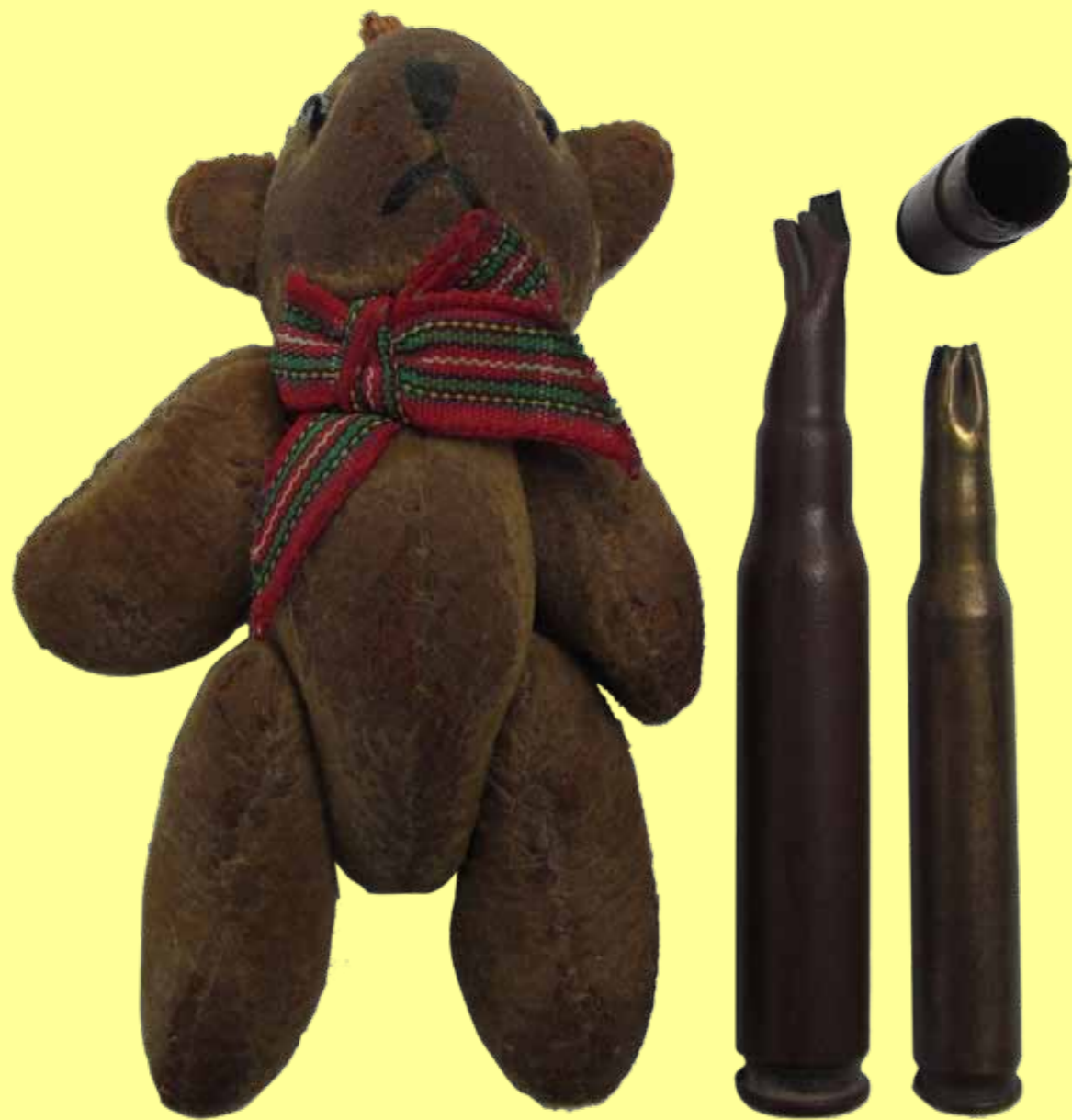
Object: sleutelhangerbeertje en kogelhuizen. Vindplaats: Rotterdam (beer) en De Veluwe. Bijzonderheden: Getuige de sluitplekken op het lijfje van beer, dagelijks vastgepakt om een deur te openen, auto te starten, het jengelende kind af te leiden bij 'vlug, vlug nog even een boodschap'. De kogels werden afgevuurd door soldaten in opleiding. Of door een Russische prijsjager op zijn trofee?

"Deze vind ik eng. Dat dacht ik net al. Een beertje en dan drie patronen ernaast. Waarvan een afgeschoten is. Ik vind het iets heel zieligs hebben. Het lijkt op mijn uuuhhhh... Ik heb een boekje met knuffels. En deze lijkt een heel dierbaar knuffeltje geweest."